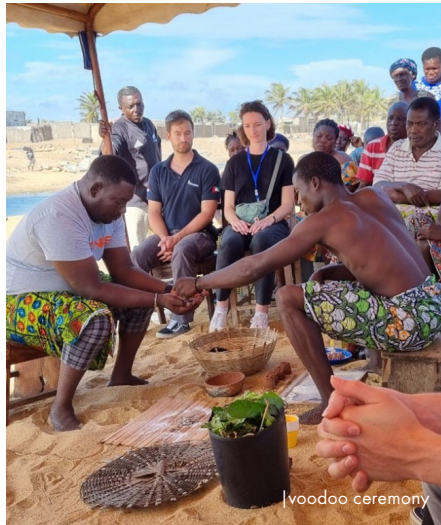
| voodoo ceremony